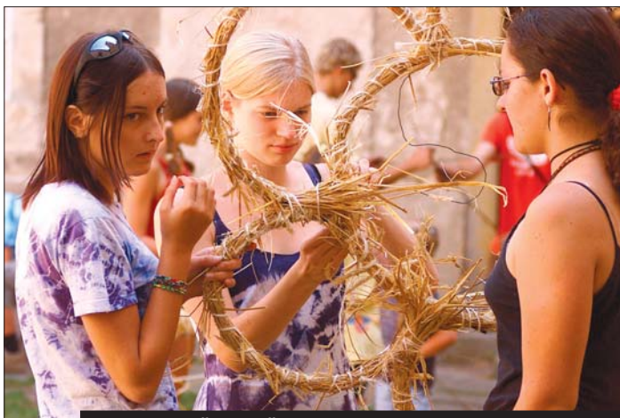
Slámování v Červené Řečici, 20.–22. srpna.