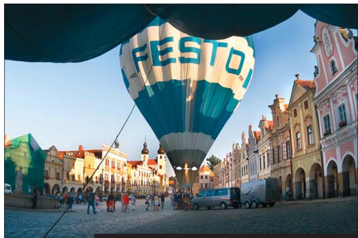
Balóny nad Telčí, 19.–22. srpna.